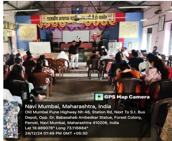
Navi Mumbai, Maharashtra, India Old Mumbai Pune Highway Nh 48, Station Rd, Next To S.t. Bus Depot, Opp. Dr. Babasaheb Ambedkar Statue, Forest Colony, Panvel, Navi Mumbai, Maharashtra 410206, India Lat 18.989076° Long 73.116884° 24/12/24 01:49 PM GMT +05:30