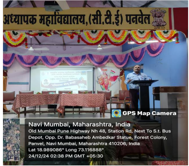
Navi Mumbai, Maharashtra, India Old Mumbai Pune Highway Nh 48, Station Rd, Next To S.t. Bus Depot, Opp. Dr. Babasaheb Ambedkar Statue, Forest Colony, Panvel, Navi Mumbai, Maharashtra 410206, India Lat 18.989086° Long 73.116888° 24/12/24 02:38 PM GMT +05:30