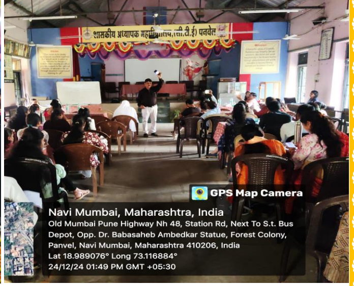
Navi Mumbai, Maharashtra, India Old Mumbai Pune Highway Nh 48, Station Rd, Next To S.t. Bus Depot, Opp. Dr. Babasaheb Ambedkar Statue, Forest Colony, Panvel, Navi Mumbai, Maharashtra 410206, India Lat 18.989076° Long 73.116884° 24/12/24 01:49 PM GMT +05:30