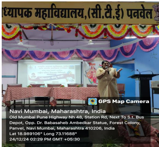
Navi Mumbai, Maharashtra, India Old Mumbai Pune Highway Nh 48, Station Rd, Next To S.t. Bus Depot, Opp. Dr. Babasaheb Ambedkar Statue, Forest Colony, Panvel, Navi Mumbai, Maharashtra 410206, India Lat 18.989106° Long 73.11688° 24/12/24 02:29 PM GMT +05:30