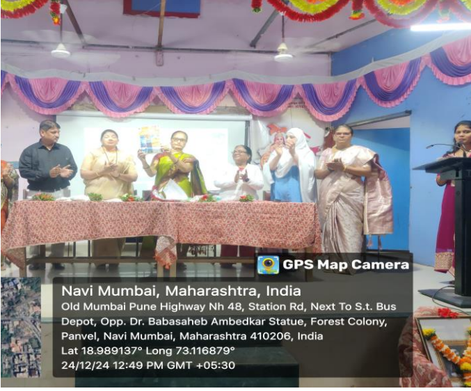
Navi Mumbai, Maharashtra, India Old Mumbai Pune Highway Nh 48, Station Rd, Next To S.t. Bus Depot, Opp. Dr. Babasaheb Ambedkar Statue, Forest Colony, Panvel, Navi Mumbai, Maharashtra 410206, India Lat 18.989137° Long 73.116879° 24/12/24 12:49 PM GMT +05:30