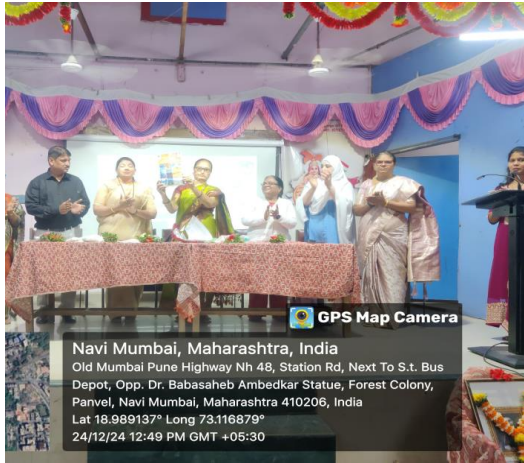
Navi Mumbai, Maharashtra, India Old Mumbai Pune Highway Nh 48, Station Rd, Next To S.t. Bus Depot, Opp. Dr. Babasaheb Ambedkar Statue, Forest Colony, Panvel, Navi Mumbai, Maharashtra 410206, India Lat 18.989137° Long 73.116879° 24/12/24 12:49 PM GMT +05:30