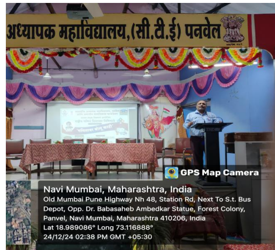
Navi Mumbai, Maharashtra, India Old Mumbai Pune Highway Nh 48, Station Rd, Next To S.t. Bus Depot, Opp. Dr. Babasaheb Ambedkar Statue, Forest Colony, Panvel, Navi Mumbai, Maharashtra 410206, India Lat 18.989086° Long 73.116888° 24/12/24 02:38 PM GMT +05:30