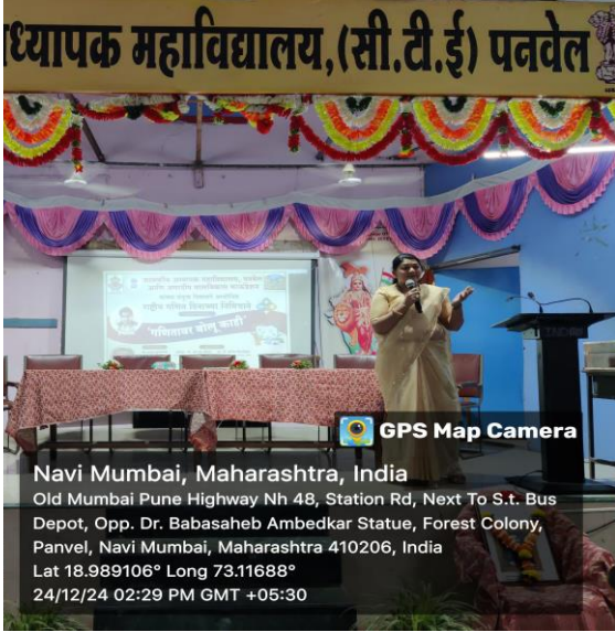
Navi Mumbai, Maharashtra, India Old Mumbai Pune Highway Nh 48, Station Rd, Next To S.t. Bus Depot, Opp. Dr. Babasaheb Ambedkar Statue, Forest Colony, Panvel, Navi Mumbai, Maharashtra 410206, India Lat 18.989106° Long 73.11688° 24/12/24 02:29 PM GMT +05:30