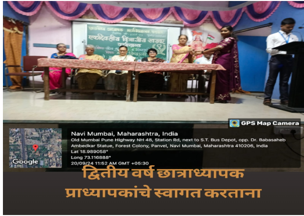
द्वितीय वर्ष छात्राध्यापक प्राध्यापकांचे स्वागत करताना