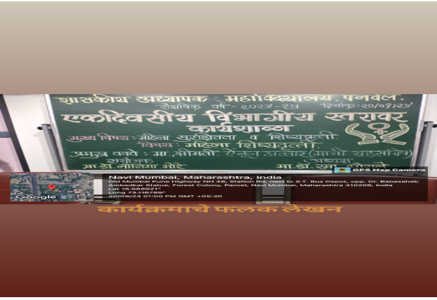
कार्यक्रमाचे फलक लेखन