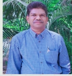
संपादक - प्रा. डॉ. बी. जी. खाडे