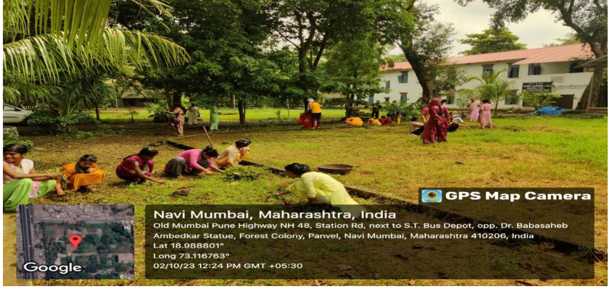
२ ऑक्टोबर २०२३ महाविद्यालय परिसर सफाई